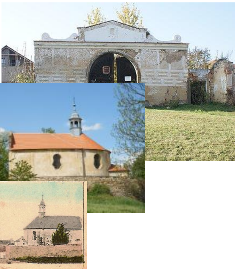
Sekvence obrázků č. 1 Renesanční sgrafitová brána a Kostel Stětí sv. Jana Křtitele